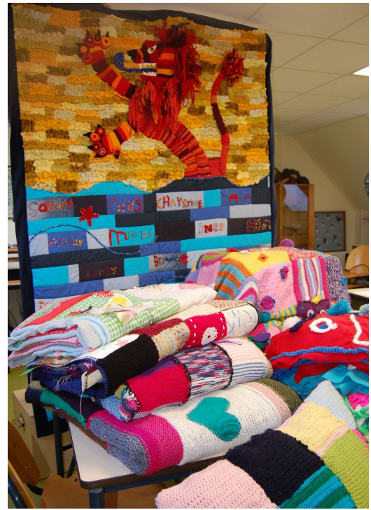
Actie "Warme truiendag"