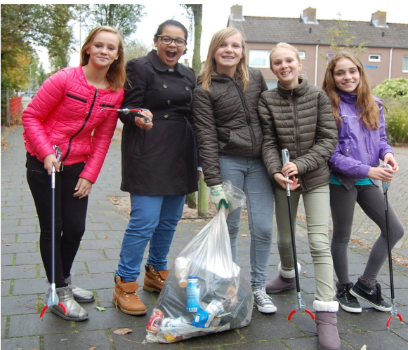
Zwerfvuil rapen met Ostrea