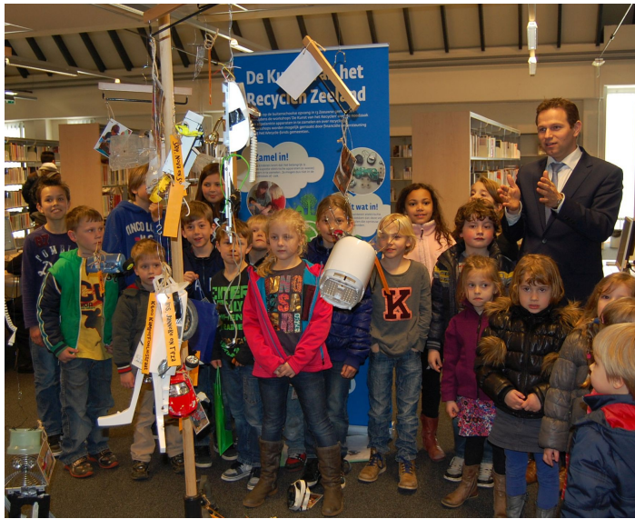
Prijsuitreiking "De kunst van het recycelen"