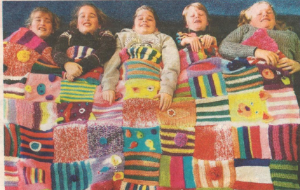
De kinderen van Ommisschool De Poel onder hun zelfgemaakte dekens.