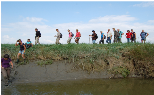
Met de vrijwilligers op pad