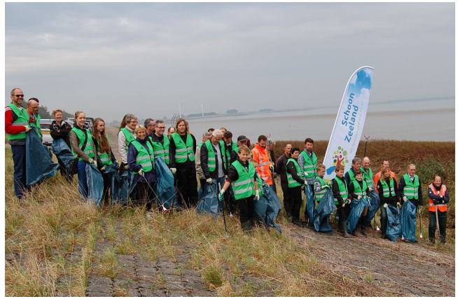
Schone Schelde gemeente Reimerswaal