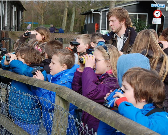
Jeugdactiviteit "Op pad met de boswachter"