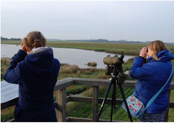
Natuuroudercursus thema "Vogels"