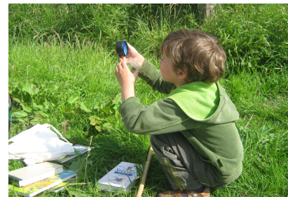
Jong geleerd = oud gedaan