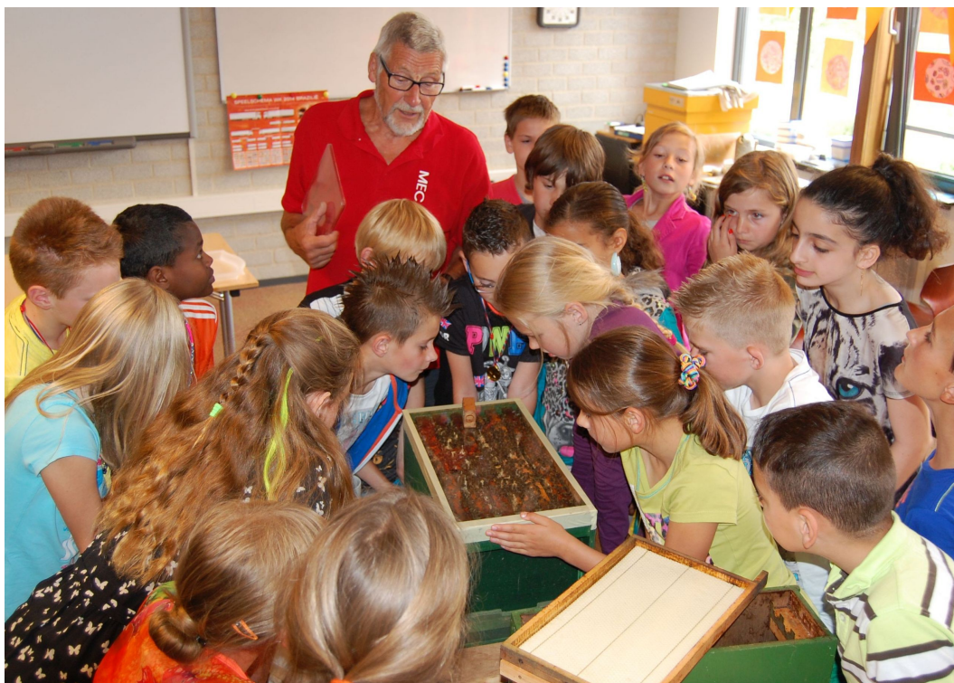
Bijen in Borsele