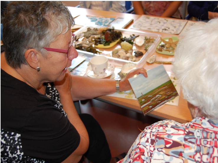
Lezing voor ouderen "Terugblik op de Oosterschelde"