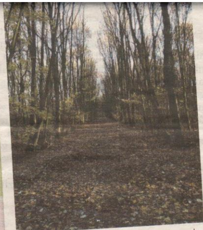
Een pad met kaarsrechte bomen voert uiteindelijk naar de Dankerseweg.