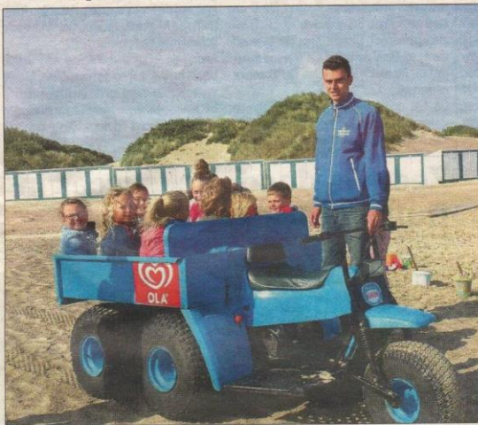
Leerlingen in de laadbak op weg om afval te jatten

KAMPERLAND - Leerlingen van 3 scholen uit Noord-Beveland kregen de afgelopen week les op het Banjaardstrand bij Kamperland.