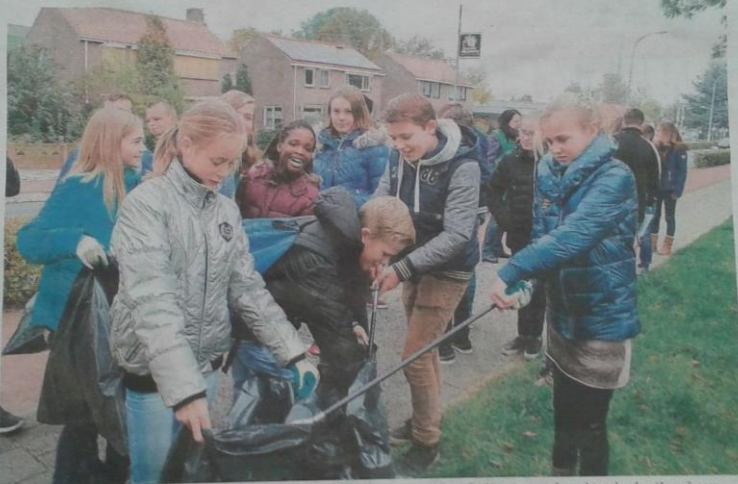
Leerlingen van brugklas H di van het Ostrea Lyceum locatie Fruitlaan verzamelden afgelopen maandagochtend vol enthousiasme zwerfafval in Goes-Zuid.

GOES - De leerlingen hebben al verschillende lessen achter de rug over zwerfafval en de gevolgen hiervan voor mens, dier en milieu. Nadat het zwerfafval was opgeruimd, stapten om 13.00 uur de eerstejaars Mavo-leerlingen op de fiets en gingen ze op bezoek bij verschillende bedrijven in Goes, zoals Synergyhealth, Praxis, de Milieustraat, Trampet Goes, Mac Donald's, Delta Milieu Recycling en andere bedrijven. Hier kregen ze een rondleiding en informatie over de wijze waarop in het bedrijf met het afval wordt omgegaan. Later reden de eerstejaars Mavo-leerlingen dezelfde route. De bedoeling is dat de leerlingen na deze dag verder aan de slag gaan met de verkregen informatie door het verzamelen van zwerfafval. Ze krijgen zo