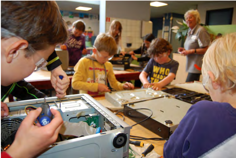
Project: "De kunst van het recyclen"