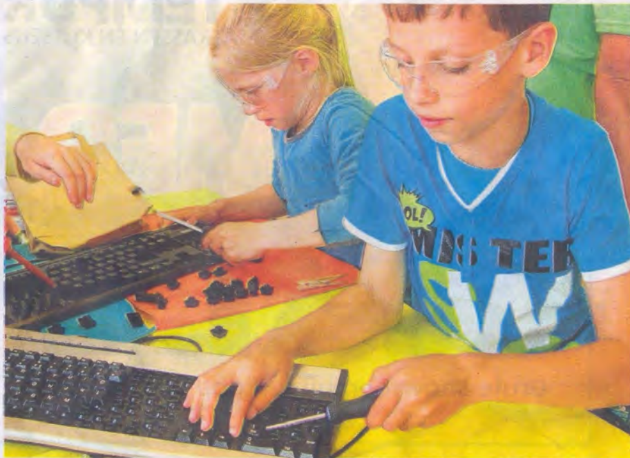
Op de BSO aan de Boogstraat in 's-Heer Arendskerke zijn de kinderen een toetsenbord uit elkaar aan het halen. Straks zullen ze van alle losse onderdelen een kunstwerk gaan maken.