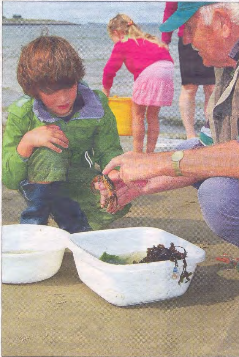
Zelf op zoek gaan naar de schatten van de Oosterschelde. IVN natuurgidsen geven uitleg over wat je gevonden hebt.

GOES - Op zondag 8 september zullen tussen 12.00 en 14.00 uur duikers van de Biologische Werkgroep van de Nederlandse Onderwatersport Bond in samenwerking met IVN-natuurgidsen en MEC De Bevelanden bij het Goese Sas een middag voor jong en oud organiseren.