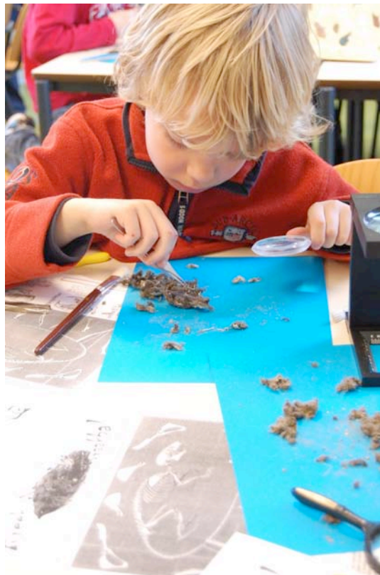
Jeugdactiviteit "Breek de braakbal", pag. 14

Daarnaast waren er contacten met Terra Maris, de Schaapskooi in Nisse, KNNV De Bevelanden, Stichting Landschapsbeheer Zeeland (SLZ), Natuurmonumenten, Staatsbosbeheer, St. Zeeuws landschap e.a..