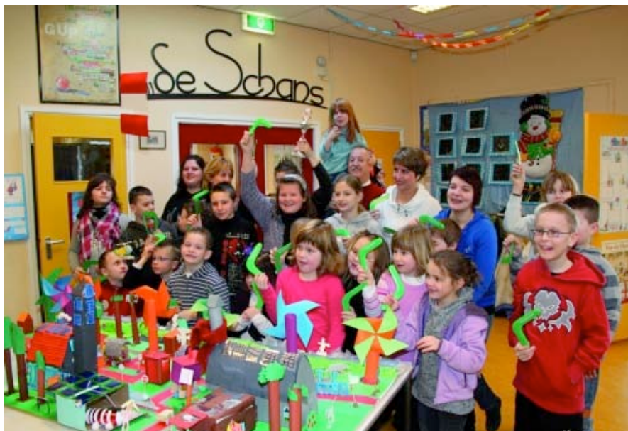
Warme truiendag gemeente Borsele, pag. 10

In dit kader kwam een delegatie van bestuurders uit Kamuli o.a. langs bij het MEC waar men uitleg kreeg hoe voorlichting aan basisschoolleerlingen wordt gegeven over dit onderwerp. Men vond het interessant en stelde volop vragen aan de coördinator en een medewerker van MICMEC-Walcheren.