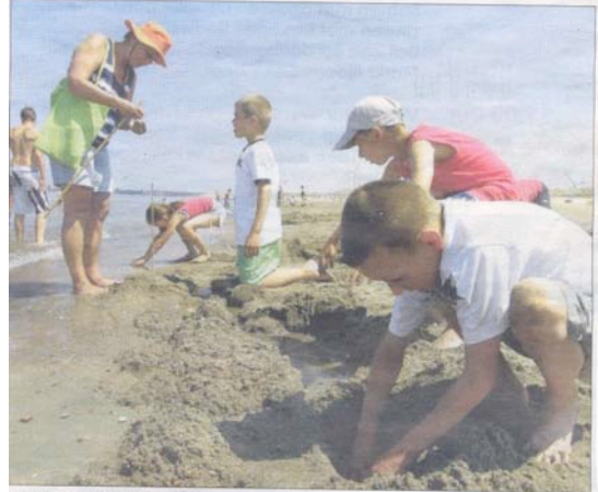
Ten aanzicht kinderen in bezig op het strand.